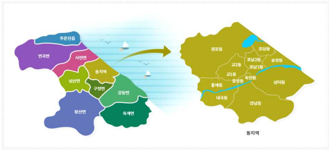
[그림 I-1] 강릉시 행정구역

2025년 10월 기준 강릉시 행정구역별 청소년 수를 살펴보면 총 청소년(9세~24세)의 인구 27,450명 중 가장 많은 청소년이 거주하고 있는 곳은 교1동이다. 하지만, 강릉시 행정구역별 인구대비 비율이 높은 지역은 경포동으로 나타나고 있다.